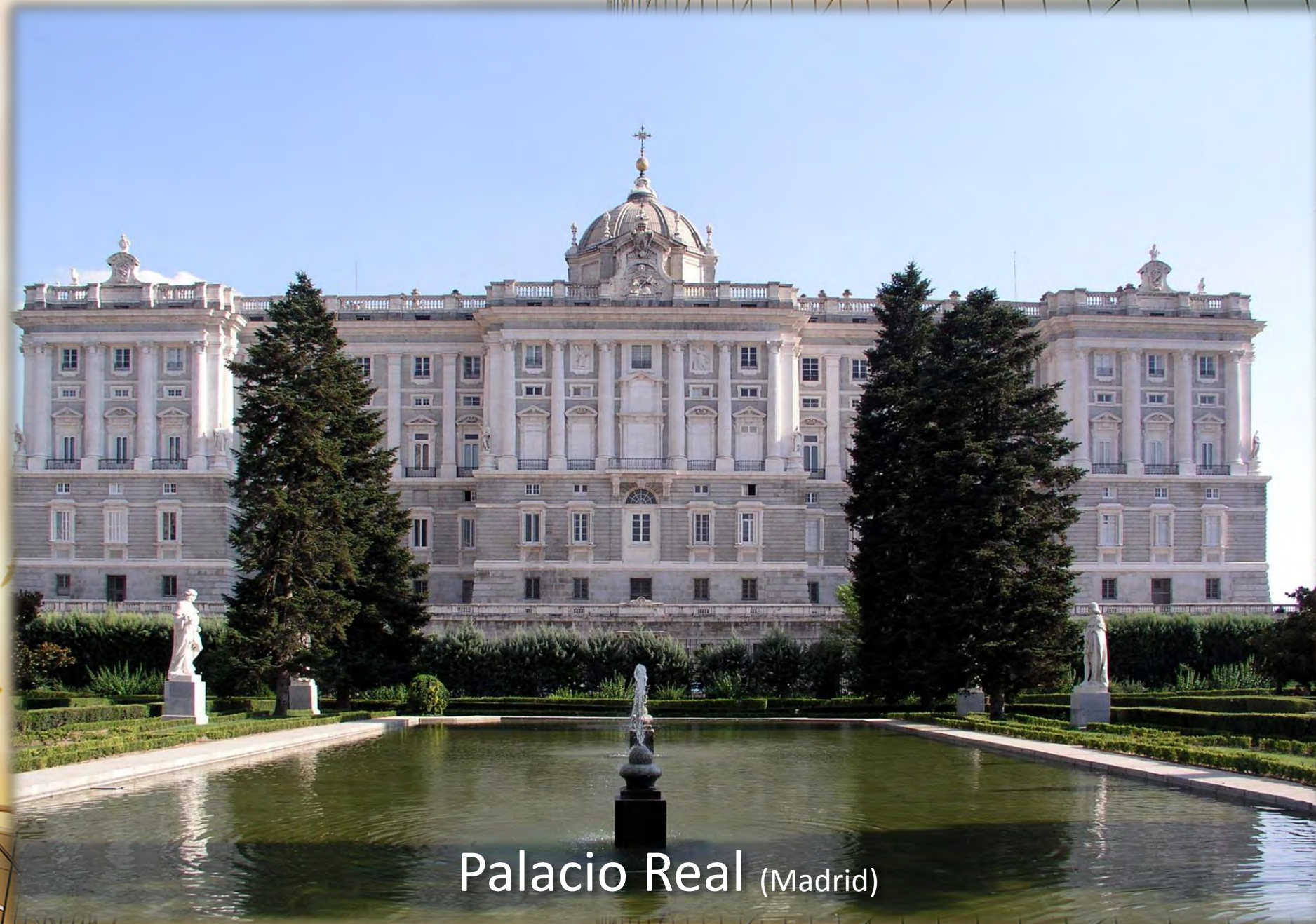
Palacio Real (Madrid)