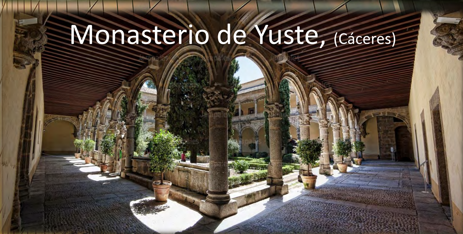
Monasterio de Yuste, (Cáceres)