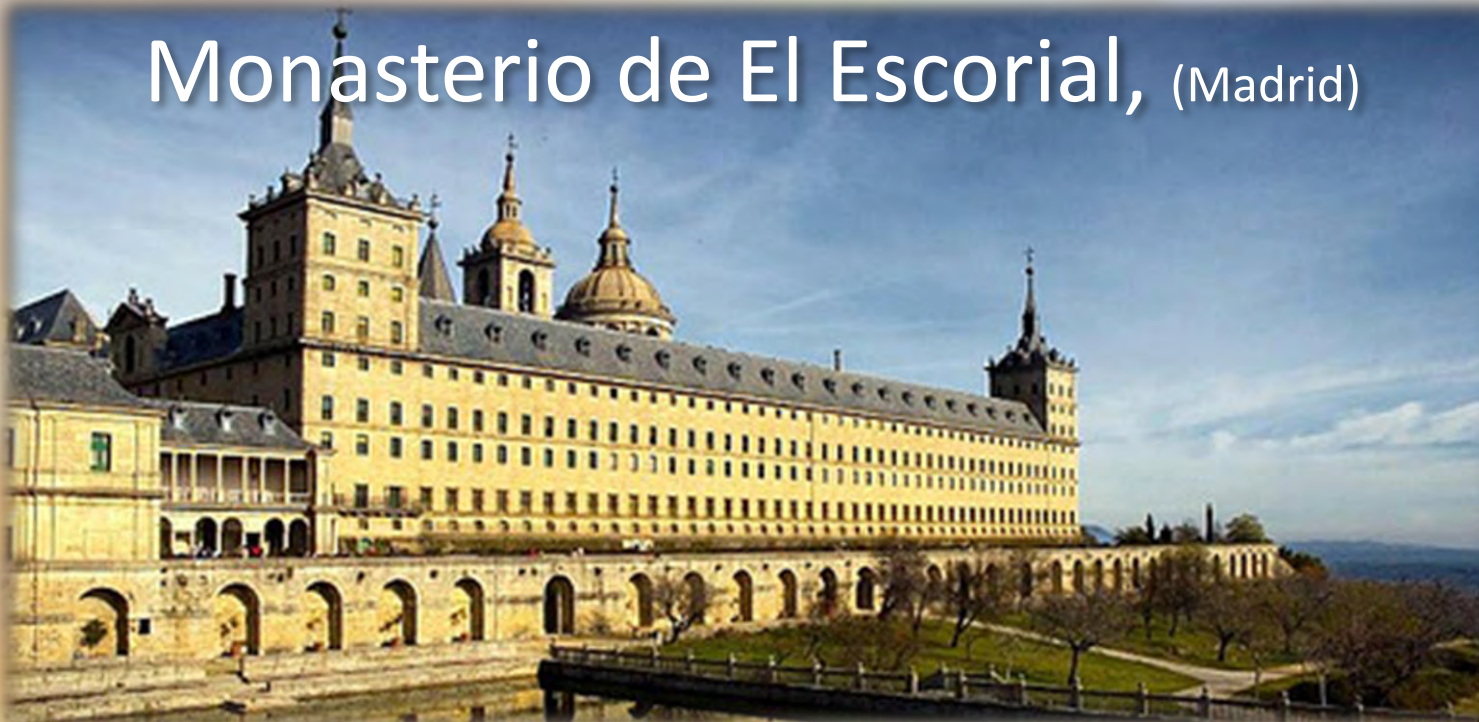
Monasterio de El Escorial, (Madrid)